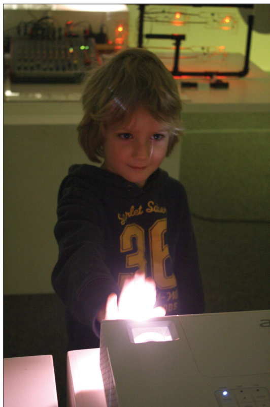
Slika 1: Sodobne multimedijske postavitve umetniških razstav so mlajšim otrokom »pisane na kožo«.

valih). Zelo so jih privlačili svetlobni elementi; roke so nastavljali v svetlobne snope, poskušali so se dotakniti predvajane podobe na steno (Slika 1). Otroci so se med seboj veliko pogovarjali in navdušeno drug drugemu predstavljali svoje ugotovitve (npr. ko je otrok odkril, da zvok prihaja iz cevi, je poklical druge otroke, da jim to pokaže). Opazili smo tudi, da so se odzivali s svojimi glasovi, npr. s smehom ali vriskanjem, ko jih je v objektih kaj nenadoma presenetilo.