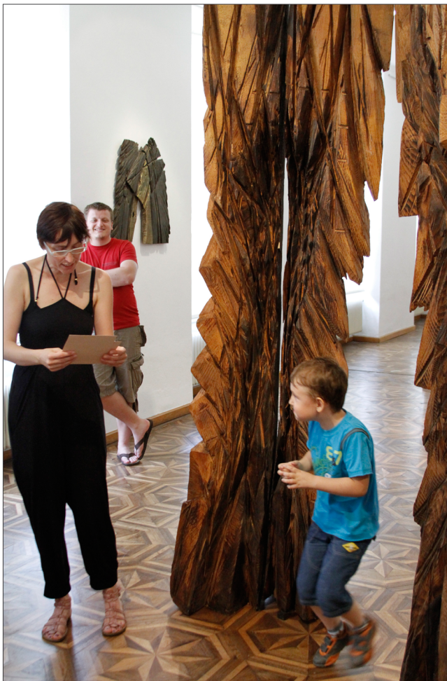
Slika 4: Na prehajanje skozi umetnino se je deček odzval s celim telesom: sklonil se je, roke je stisnil k telesu, pospešil je korak ter se previdno oziral, da ne bi obdrgnil ob lesene špice, pri tem je bil zelo pripoveden tudi njegov izraz na obrazu.

se njihovi potrebi po gibanju, hkrati pa se jih spodbuja v poglobljeno opazovanje ter v bolj čustveno vživljanje v svet, ki ga je ustvaril umetnik (motorična dejavnost je namreč povezana z močnimi čustvi). Ogledi razstav v UGM zato pogosto vključujejo takšne igre, ko npr. otroci s telesom prikažejo dejanje, predmet ali osebo, ki jo opazujejo in spoznavajo v umetnini (Slika 5). Takšna aktivnost se nujno prepleta z metodo pogovora, da otroci opažanja in doživetja tudi ubesedijo in ozavestijo, podkrepijo pa jih lahko tudi z likovnim poustvarjanjem.