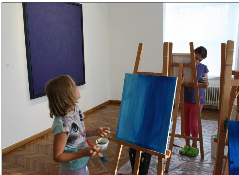
Slika 6: Skozi likovno izražanje v galeriji otroci razvijajo bolj poglobljeno opazovanje in interpretacijo razstavljenih umetnin, hkrati pa bogatijo svoj osebni likovni izraz.

»odstranjevanje »ovir« (umetniških del) ni pripeljalo otrok do osebnega stila in kreativnosti, ampak, prav nasprotno, do »stereotipov« do tega, da so posnemali drug drugega in risali enake hiše, drevesa, sonca, itd.« (1992: str. 7). Kar pomeni, da potrebujejo vzore, in kadar se otroci z njimi srečujejo dovolj pogosto in redno, se postopoma elementi strukturirajo in stapljajo z drugimi življenjskimi izkušnjami, kar obogati otrokov individualni izraz. Ta je drugačen od izraza nekoga drugega, kar vpliva na izpostavljanje in sprejemanje različnosti kot tudi na otrokovo samozavedanje kot enkratnega bitja. Zato lahko rečemo, da umetniška dela pomembno podpirajo razvoj otrokovega osebnega stila.