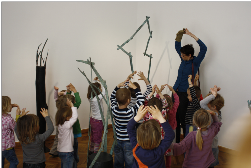
Slika 5: S svojimi telesi otroci izražajo, kar si ogledujejo: umetnina je visoka, na vrhu je špičasta, spominja na drevo, palčka ali goro.

Kadar sta v ospredju metodi pogovora in razlage, načrtujemo tudi »negibanje« oz. sedenje v (pol)krogu. Pri tem si otroci ne prekrivajo pogleda na umetnino, vsi vidijo drug drugemu v obraz, omogočen jim je očesni kontakt, kar spodbuja enakovredno vključevanje vseh v pogovor.