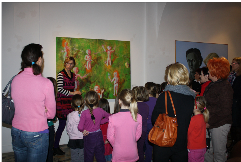
Slika 2: Vodeni ogled po razstavi za otroke, mame in babice v UGM: raznoliko občinstvo omogoča izmenjavo različnih pogledov in idej o umetnosti, s tem pa se pri vseh bogati razumevanje in doživljanje umetnosti.

Izkušnje otrok s sodobno umetnostjo so lahko zelo raznolike; v stiku z umetnino lahko uživajo, so zadovoljni, lahko pa jih je tudi strah ali se jim vzbudi žalost. Njihov odziv pa nikakor ne smemo obravnavati kot napačen, saj je v vsakem primeru posledica njihovih življenjskih izkušenj, spomina, trenutnega razpoloženja, okusa ... Zavračanje tega kot napačnega bi pomenilo zavračanje otrokovih občutkov in izvirnih idej, ki so odraz njegove edinstvene osebnosti. Dialog, v katerem se delijo različna mnenja, sicer lahko vključuje tudi neprijetne občutke, vendar tudi to sodi v učni proces, ki spodbuja ustvarjalno in kritično odzivanje. Pri tem imajo pomembno mesto muzejski pedagogi, ki spodbujajo konverzacijo med vsemi udeleženci ter skrbijo, da se lahko vsak vanjo enakovredno vključuje. Durant (1996: str. 20) piše: »/K/o se vse otroke spodbuja, da se izražajo s svojim avtentičnim glasom, ko izražajo svoja občutja in ideje ter jih delijo z drugimi v skupini, raste razumevanje vseh. Kadar prihajajo iz različnih okoliščin, sta bogastvo in raznolikost zaznav in idej toliko večja.«