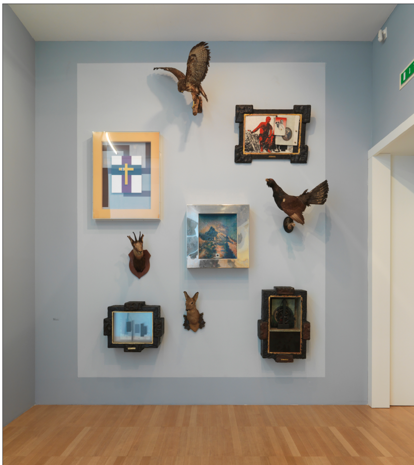
Irwin, Kapital , 1987–2008. Na razstavi 20. stoletje. Kontinuitete in prelomi , stalna postavitev, Moderna galerija, Ljubljana, 2011- (foto: Matija Pavlovec, foto z dovoljenjem Moderne galerije, Ljubljana).

dvajsetih let v drugi dvorani, partizanske umetnosti v tretji dvorani in OHO-ja v četrti dvorani do NSK v peti dvorani). Poleg Kapitala so v sobi še plakati skupine Novi kolektivizem in glasbene skupine Laibach, ki se je v začetku svojega delovanja prav tako ukvarjala z likovno umetnostjo. Kapital je začel nastajati tik pred razpadom Jugoslavije, produkcija pa se je nadaljevala v času velikih političnih sprememb. V umetnosti se je takrat začel porajati postmodernizem.